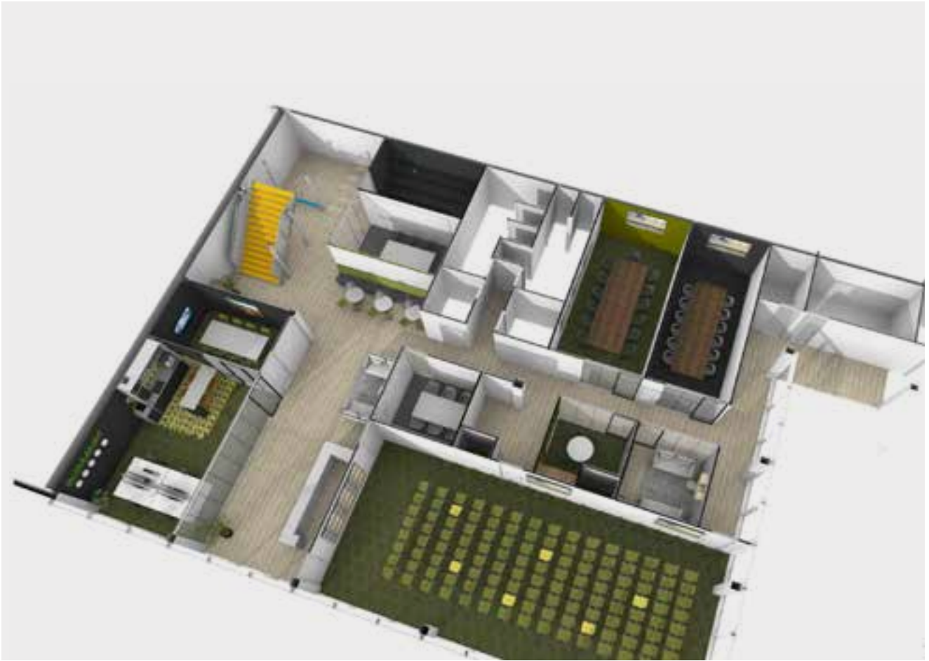
Begane grond Business Center