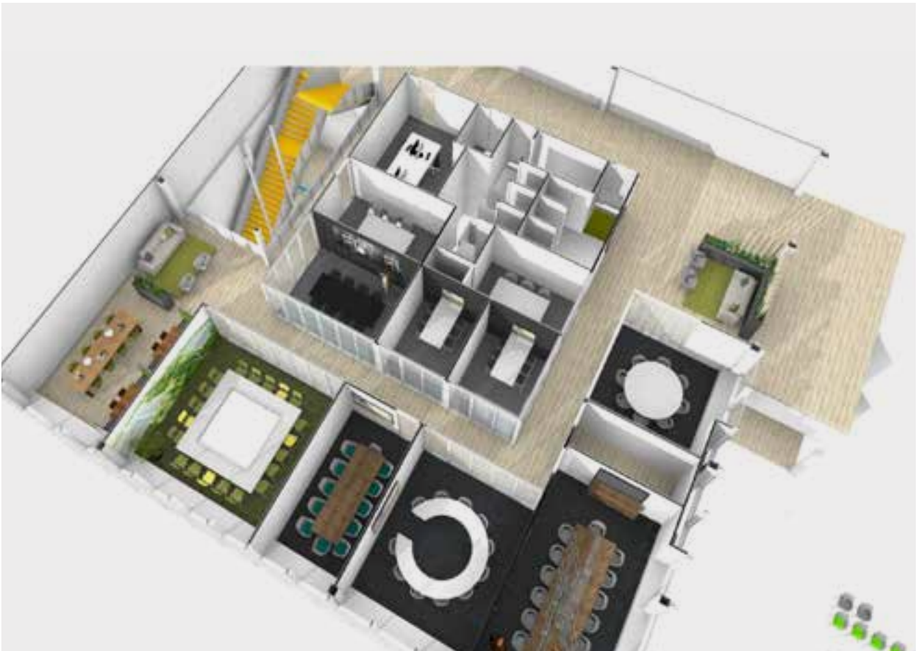
Eerste verdieping Business Center